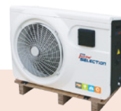
fijación sobre paleta de madera