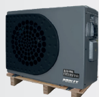
Se entrega en palé de madera