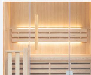
Grande surface vitrée : vue panoramique