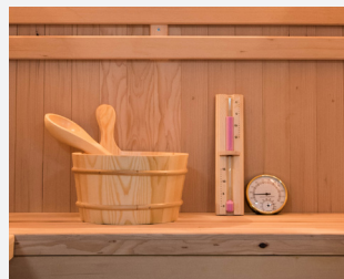
Kit sauna inclus