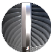
Estructura anticorrosión de acero inoxidable.