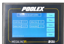
Panel de control de color de gran formato