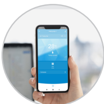
Conexión WiFi para control remoto