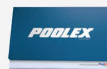
Manuel d'installation et d'utilisation multilingues