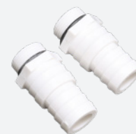
Connecteurs PVC Ø 32-38mm