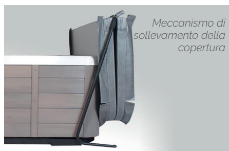
Meccanismo di sollevamento della copertura