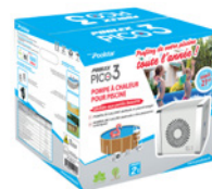
Packaging ready to buy Embalaje multilingüe con estructura reforzada e incluye todos los accesorios