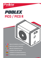
Instalación multilingüe y manual de usuario