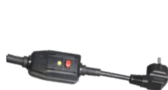
Toma de corriente de 5 m con protección diferencial 10 mA