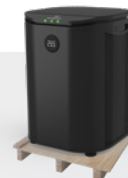
Livraison sur palette bois

* volume de bassin prévus pour une baignade de mai à septembre dans un bassin couvert avec skimmers