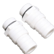
Raccordements Ø 32-38mm