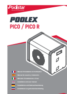
Manuel d'installation et d'utilisation multilingues