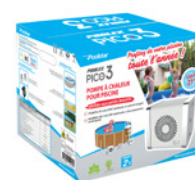
Packaging ready to buy Emballage multi-langues avec structure renforcée, incluant l'ensemble des accessoires