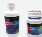
Colle PVC souple (bleue) + Décapant