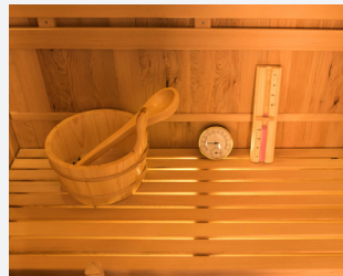
Kit sauna incluido