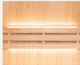
Tiras LED discretas